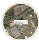
Vue Google Satellite