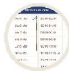
Historique sur 1 mois