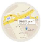
Suivi en temps réel

Paramétrez des rapports avec la fréquence et le contenu de votre choix. Il sera envoyé automatiquement sur votre boîte e-mail.