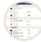
Etat du véhicule