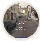
Vue Google Street